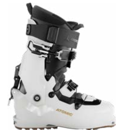
ATOMIC Backland XTD 105 W GW