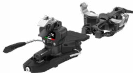
ATK RT 11 Evo Black