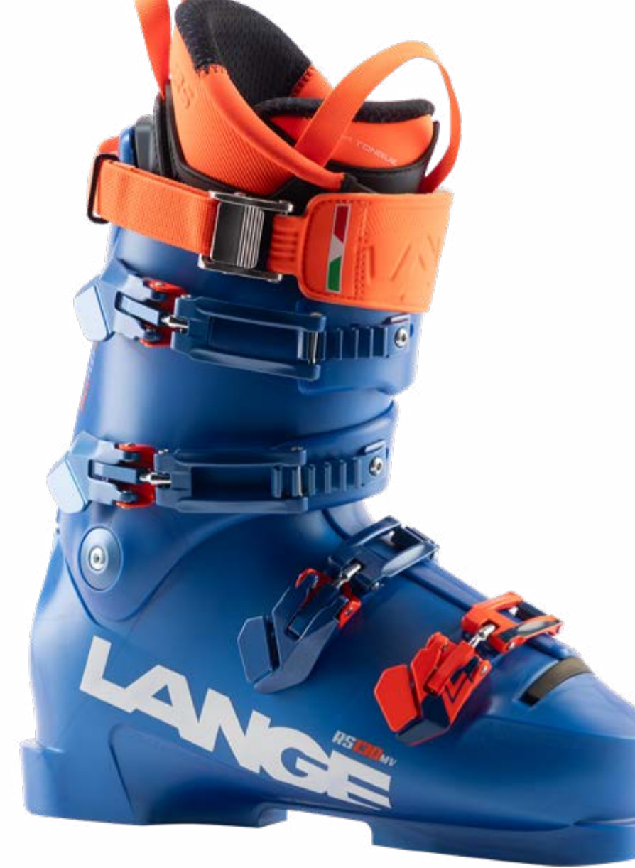
LANGE RS130 MV

Der neue RS hat sich von den innovativsten Sportarten und den leistungsorientiertesten Rennställen inspirieren lassen und ist ein Juwel der marginalen Gewinne. Ein Herz, das für den Sieg schlägt, eine Seele, die für das Rennen lebt. Am Starttor. In dieser kleinen Holzhütte. Allein mit sich selbst. Allein vor der Piste. Ja, du bist lebendiger als je zuvor! Alles was jetzt zählt ist Konzentration und Entschlossenheit.