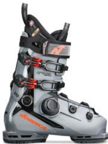
NORDICA Speedmachine 3 BOA 120 GW