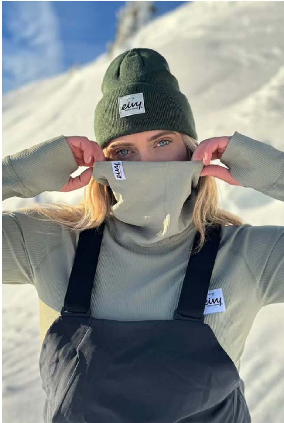
EIVY Weniger Kram – mehr Abenteuer