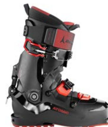
ATOMIC Backland XTD Carbon 120 GW