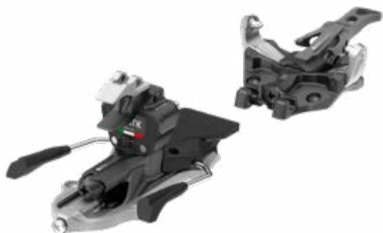
ATK R13 Evo Black

Mit seinem 100mm breiten Leisten richtet sich der Backland XTD an Tourengeher mit mittelbreiten Füßen. Sein Cross Lace 2.5 Verschlusssystem umfasst den Fuß sicher und zuverlässig und bietet einen kraftvollen Sitz und Schluss. Der Free/Lock 4.5 Aufstiegs-/Abfahrtsmechanismus erlaubt in Kombination mit dem Frictionless Pivot 74° natürliche Bewegungsfreiheit. Atmungsaktiver, waschbarer 3D Platinum Tour Innenschuh mit Dry Fit Schaum.