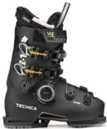
TECNICA MACH1 HV 95 W