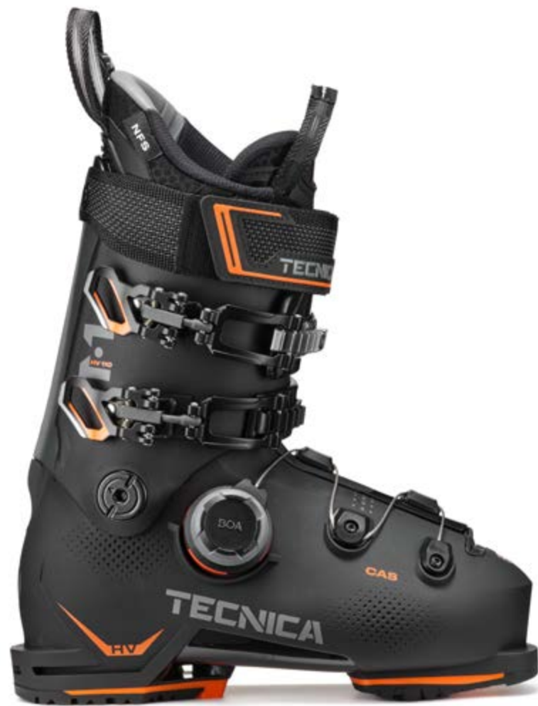
TECNICA MACH1 HV 110