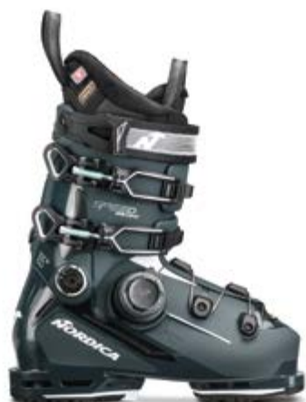
NORDICA Speedmachine 3 BOA 105 W GW