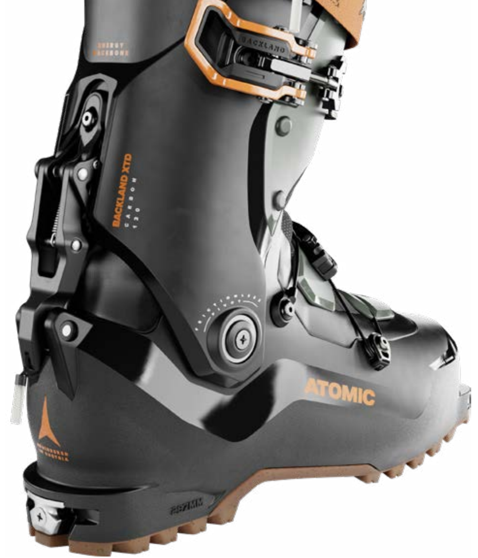
ATOMIC Backland XTD Carbon 120

ATK ist innovativ und stellt sich den Herausforderungen mit dem Fokus auf Leichtigkeit und Nachhaltigkeit. Das Unternehmen zeichnet sich durch das Recycling von Aluminiumspänen aus und gewährleistet eine effiziente Rückgewinnung und Wiedereingliederung in den Rohstoffmarkt. Sie schmieden auch Netzwerke, um das Bewusstsein und die Zusammenarbeit in ihrem Streben nach umweltfreundlichen Praktiken zu fördern.